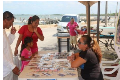
Imagen 5: Artesana de X-calak en el stand.

Durante el desarrollo de todo el evento estuvo presente en representación de sus compañeras la una artesana de Xcalak quienes elaboran bisutería (aretes, collares, pulseras con aletas del pez león y peces locales), la presencia de esta artesana y sus productos causo gran asombro entre la población local, al mostrar la diversidad de productos que se pueden obtener del pez león. Las mujeres locales expresaron su interés en conocer más acerca de actividad artesanal, así como establecer un puente de comunicación y propiciar para futuras capacitaciones.