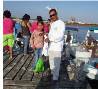
Imagen 1: Niña con su kit, antes de embarcarse

Esta se realizó el día 8 de marzo del 2014 a las 16:00 horas contando con la presencia de los niños y niñas participantes, capitanes y marineros de las embarcaciones, el objetivo de convocar darles a conocer el reglamento del torneo y hacerles entrega de insumos y artículos promocionales; para los capitanes de cada embarcación se les entrego un vale de combustible para el recorrido durante el desarrollo del evento, una regla métrica, un folder que contenía el reglamento, los formatos de registro, una guía rápida para la identificación de peces y la agenda del evento (anexo III), una tabla y las fichas de registro por competidor; y a todos se les entrego un kit que contenía un cilindro contenedor de agua (para el evento se proporcionaron bebidas hidratantes y agua fría), playera y un morral de poliéster.