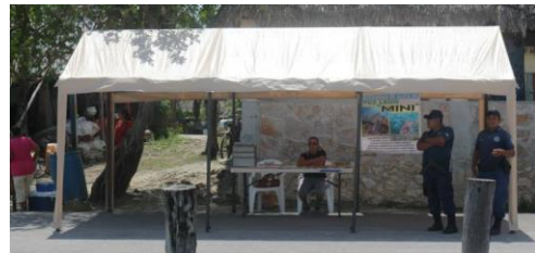
Imagen 3: Elementos de Seguridad Pública atentos para atender cualquier contingencia.

Antes, durante y después del evento no se tuvo ninguna contingencia que activará a los elementos de seguridad pública y personal de la ambulancia médica.