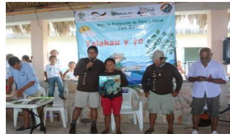
Imagen 7: Premiación de los capitanes.

También se premió al capitán y marinero de los niños que obtuvieron los tres primeros lugares.